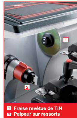
1 Fraise revêtue de TiN 2 Palpeur sur ressorts

L'aire de rangement, intégrée à la machine, est particulièrement vaste et permet de déposer de nombreuses clés et tout type d'accessoires. L'aire porte-outils réservée aux contre-pointes (optionnelles) pour les clés femelles garantit un repérage immédiat. Les copeaux sont collectés dans un tiroir spécial facilement