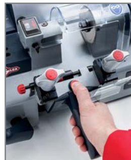
On détèle le chariot en appuyant sur un bouton dédié