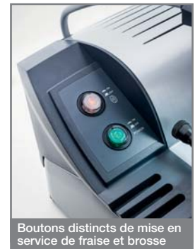
Boutons distincts de mise en service de fraise et brosse

L'interrupteur magnéthermique garantit une sécurité maximum à l'opérateur. En cas de panne de courant, il faut rallumer la machine manuellement. On ne détèlera le chariot qu'après avoir abaissé les calibres pour éviter toute rupture accidentelle.