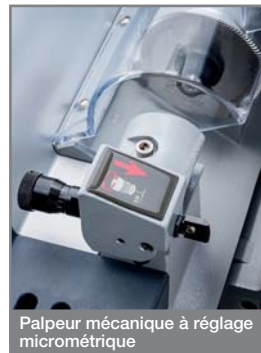
Palpeur mécanique à réglage micrométrique

La machine est dotée d'un palpeur mécanique à réglage centésimal grâce à une bague micrométrique (+/- 0,05 mm).